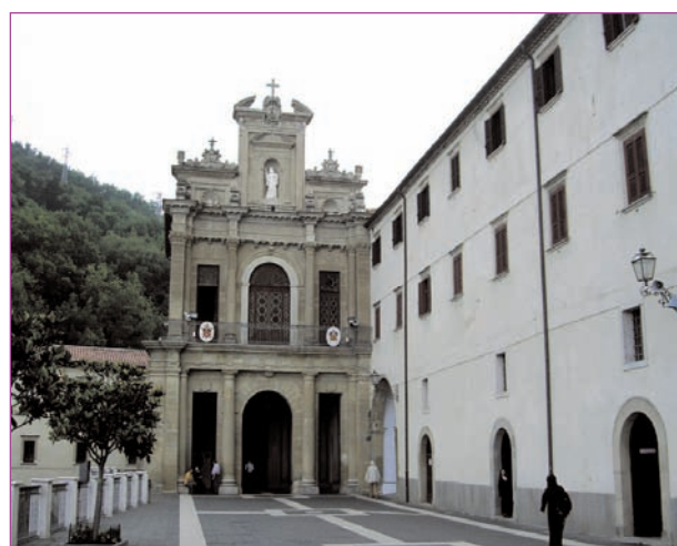
Il Santuario di Paola